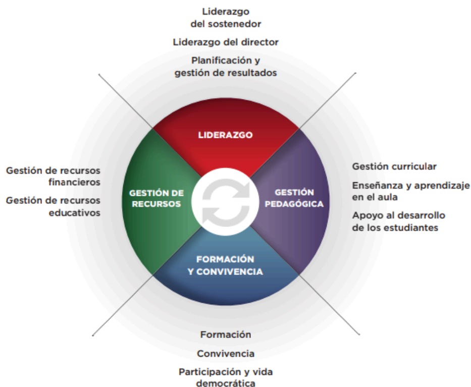
Ilustración 1.

Estándares indicativos de desempeño de sostenedores y establecimientos (2014)