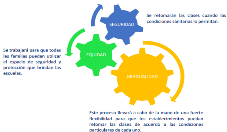
Figura 5. Principios fundamentales. Escuela Ester Silva Somarriva, (2021)

Este plan considera una modalidad mixta para trabajar el currículum priorizado ya sea de manera presencial y a distancia. Este plan de retorno a clases está basado según las orientaciones de MINEDUC y está fundado en los tres principios fundamentales dictados por este organismo los cuales se fundamentan en: