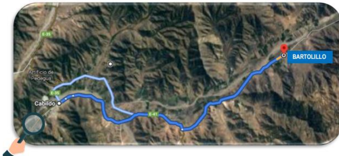
Figura 2. Ubicación geográfica. Escuela Ester Silva Somarriva, (2020)

El entorno geográfico en que se encuentra nuestro establecimiento, corresponde a una zona rural, en el sector precordillerano camino hacia el poblado de Alicahue. Desde el contexto social, los habitantes de la localidad de Bartolillo y alrededores pertenecen a un nivel socio-económico bajo, desarrollando principalmente trabajos agrícolas.