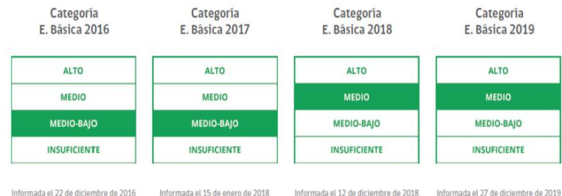
Figura 3. Resultados categoría de desempeño. Escuela Ester Silva Somarriva, (2020)