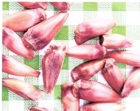
■ Semillas del pehuén, fruto sagrado del pueblo mapuche.

Los piñones son ideales para deportistas y excursionistas, ya que en poca cantidad nos aportan mucha energía y nutrientes. Además, en estados de cansancio o anemia aportan hierro.