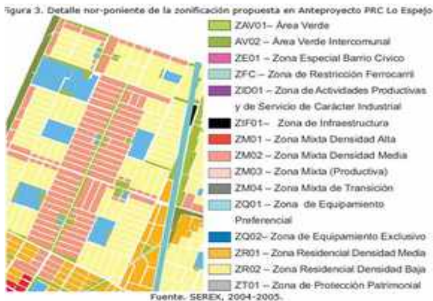
Imagen N°2: Zonificación urbana y usos de suelo en el sector José María Caro, Lo Espejo.

es casual, deriva decisiones de planificación que han asignado a este sector funciones periféricas y de menor valor urbano. En el caso de la población José María Caro, esta distribución urbana confirma lo descrito por Harvey, se trata de un territorio históricamente segregado, donde el emplazamiento de industrias y escasa inversión pública, reproducen desigualdades territoriales.