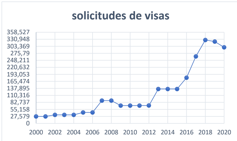
Figura°1: Número de visas otorgadas entre el año 2000 y 2020, departamento de extranjería y migración.