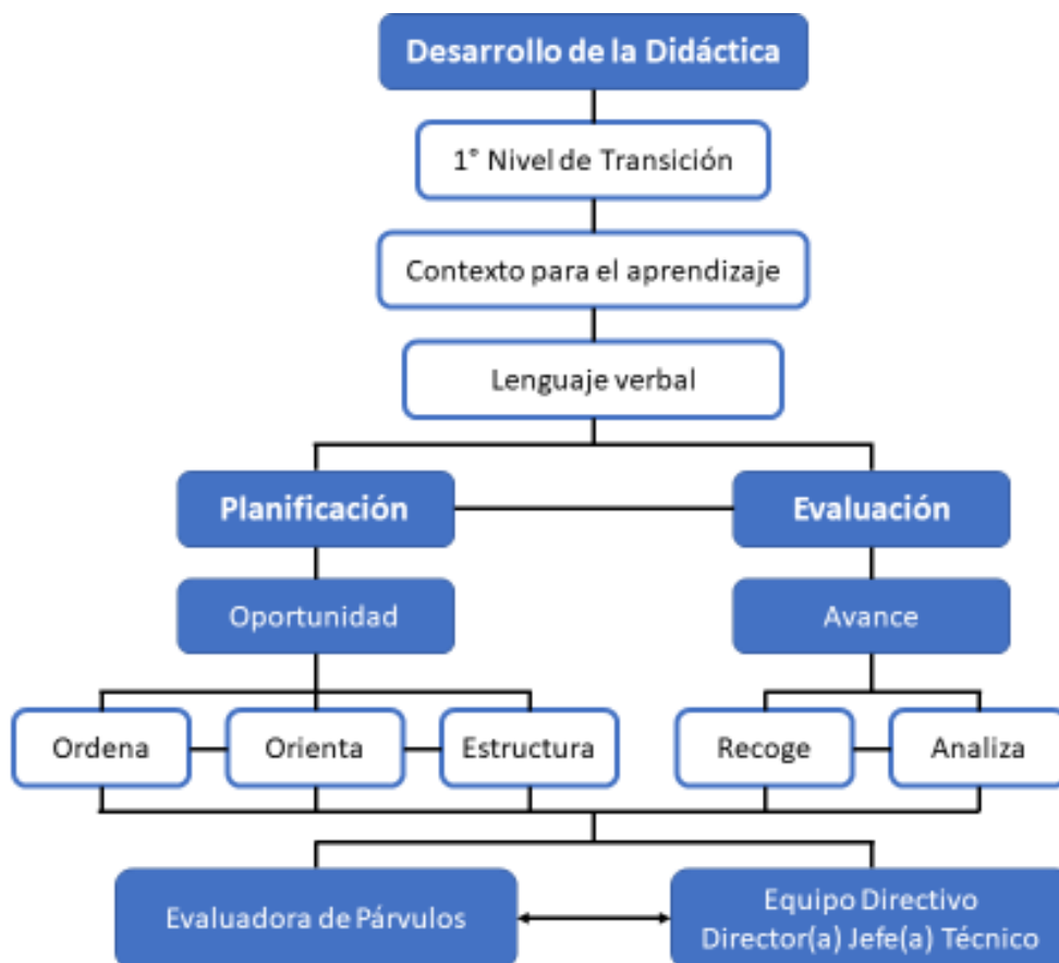
Grafica 2, articulaciones de conceptos y prácticas.

El contexto escuela donde se desenvuelve la educadora, genera instancias desde lo administrativo como desde lo técnico, existen momentos que hacen que los líderes se involucren en los distintos procesos y por ende se generan un ambiente propicio para el aprendizaje, el involucramiento positivo, da mejores resultados.