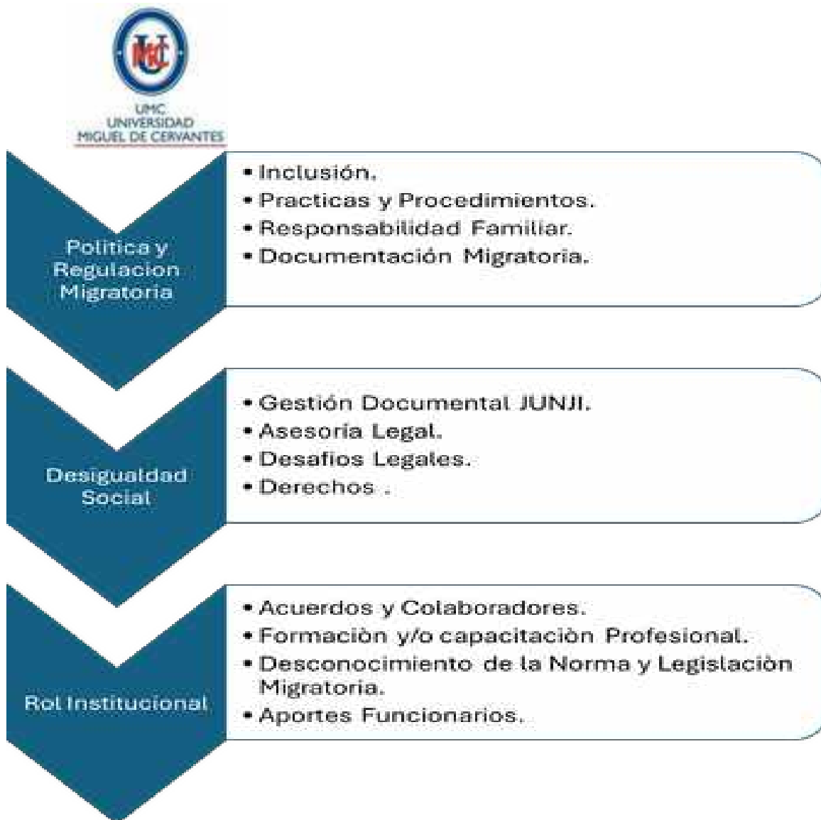
Gráfico 1: Perspectivas de los funcionarios: Explorando los Factores sociales Identificados.

Respecto a lo anterior, analizaremos cada categoría de acuerdo con el análisis de los cuestionarios presentados por los profesionales de (JUNJI), de acuerdo el siguiente orden, (ver anexo 6).