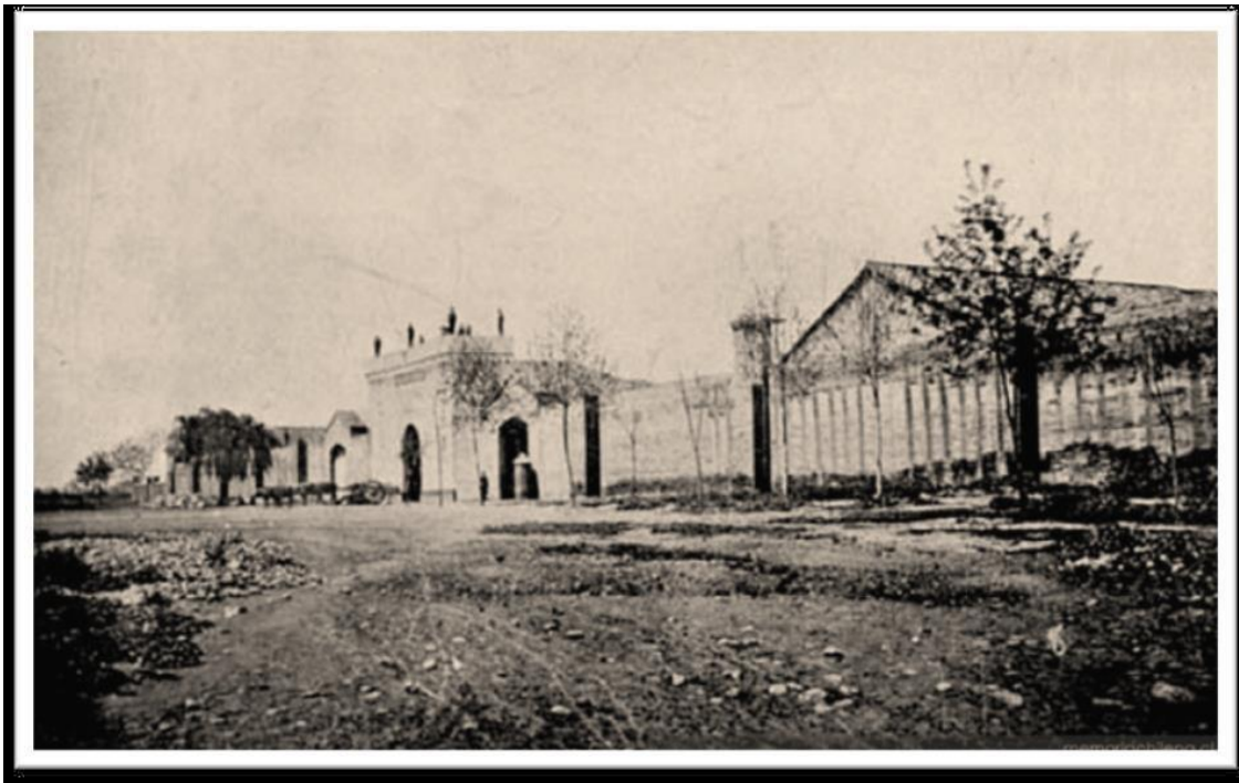
Plano para la Construcción de la Penitenciaría de Santiago en el año 1843 Penitenciaría de Santiago a fines del Siglo XIX (GENDARMERÍA, 2016, pág. 17)