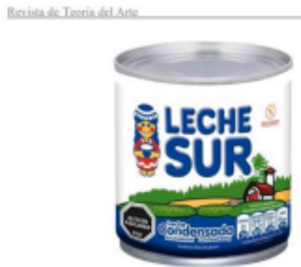
Figura 2. Lata de leche condensada con logo modificado.

Como ejemplo, podemos extraer una de las imágenes analizadas por la autora como uno de los más icónicos y reconocidos a nivel de comercialización que mostramos a continuación: