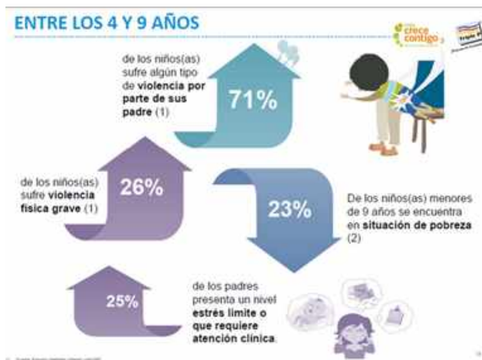
Figura 5. Tipos de violencia y otros factores de riesgo.

Según lo expuesto anteriormente, en la Figura 4 se menciona a la Encuesta Longitudinal Primera Infancia (ELPI). El Ministerio de Desarrollo Social y Familia es el responsable del levantamiento de estas encuestas. La Encuesta Longitudinal de Primera Infancia es un estudio realizado en Chile que sigue de manera periódica a una muestra de niños y niñas desde su nacimiento, con el objetivo de comprender sus trayectorias de vida y los factores que influyen en su desarrollo.