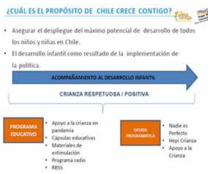
Figura 1. Funciones Chile Crece Contigo