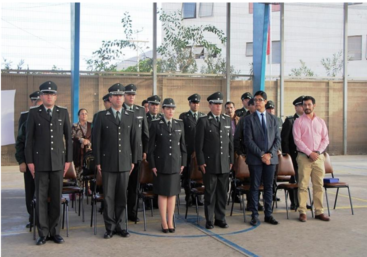
(Fotografía del personal Destacamento del C.I.P – C.R.C. de Arica)

Su principal finalidad, es dar cumplimiento a las órdenes de la autoridad Judicial jurisdiccional, que es la permanencia de los menores dentro de los centros, debiendo intervenir ante cualquier intento de evasión, rescate de personas internadas, ataques exteriores y, por último, los desórdenes o motines que sean ocasionados al interior de los centros.