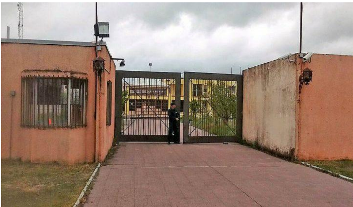
Fotografía del frontis del Centro de Internación Provisoria de Coronel

Por otro lado, existen los centros de internación que no son penas ordenadas por un tribunal, y son individualizados como Centros Semicerrado, establecen la residencia obligatoria del menor, pero se cuenta con programas que se desarrollan también en el exterior del establecimiento, también a cargo del SENAME y sin la custodia perimetral del servicio Gendarmería de Chile.