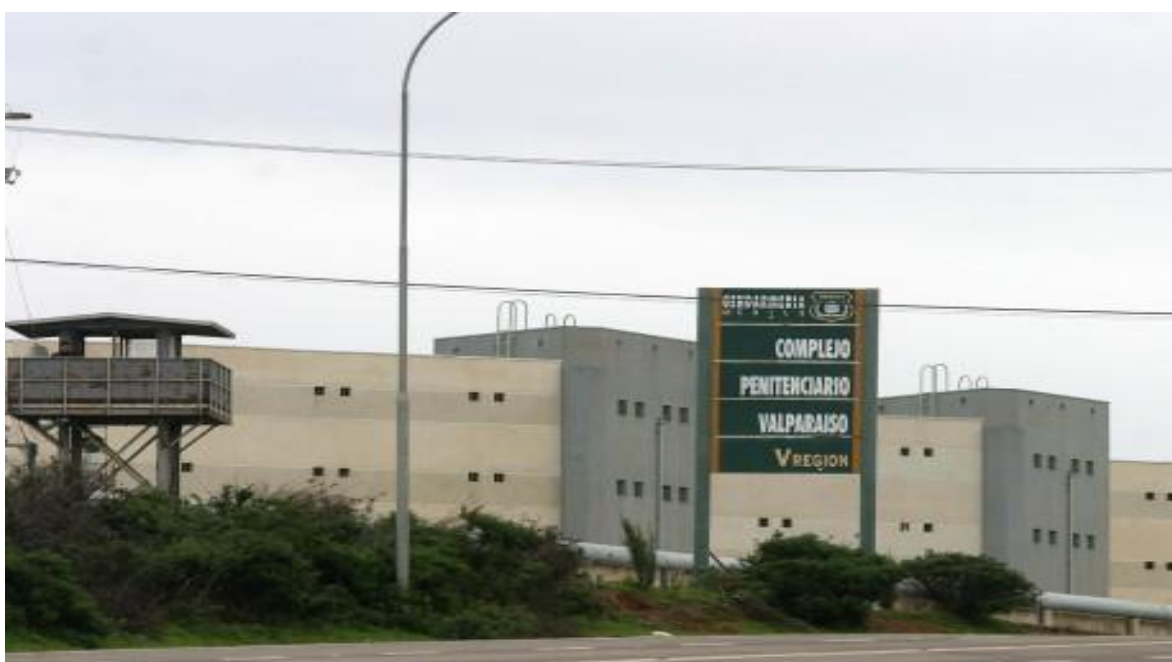
Fotografía Frontis del C.P de Valparaíso

Los Centros de educación y Trabajo: Son establecimientos penitenciarios destinados únicamente al desarrollo de trabajos o actividades remuneradas para los internos, configurando como un tipo de tratamiento de reinserción social, estos pueden ser Centros Abiertos, Centros Agrícolas o tendrán otra denominación específica aprobada por la Administración Penitenciaria.