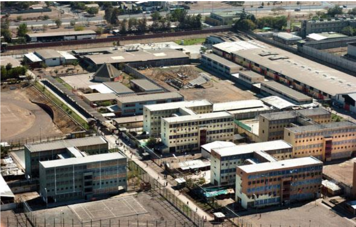
Fotografía Aérea del Penal C.C.P. Colina II

Centros Penitenciarios Femeninos: Son los establecimientos penitenciarios destinados a la reclusión y atención de mujeres, en sus diferentes regímenes abierto cerrado mixto, y en ellos, existirán dependencias suficientes y en condiciones adecuadas para el cuidado y tratamiento pre y postnatal, así como para la atención de los hijos lactantes de las internas (C.P.F.).