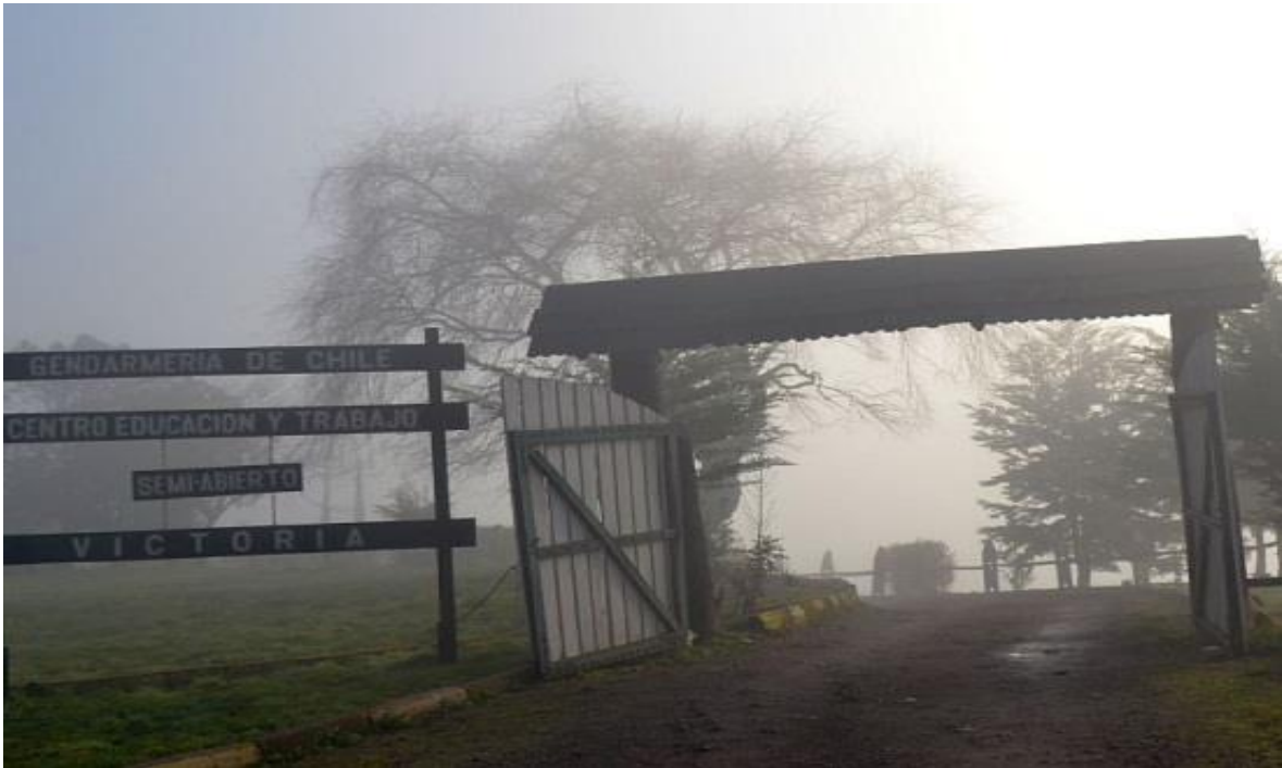
Fotografía Frontis del C.E.T. de Victoria.