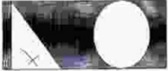
View of (triangle & circle)