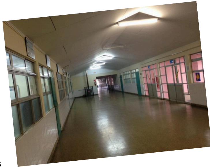
Hall y salas de Clases