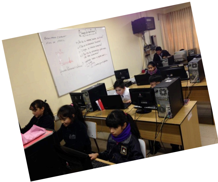
Sala de Computación