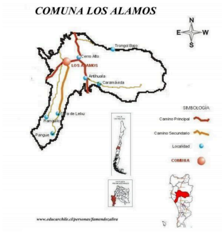
(Figura N° 1: Localización comuna de Los Álamos)

Los Álamos es una de las siete comunas que componen la provincia de Arauco, en la Región del Biobío, se ubica aproximadamente a 116 Km de Concepción, capital regional. Limita al norte con la comuna de Curanilahue, al sur con la comuna de Cañete, al este con las comunas de Curanilahue y Angol (Región de la Araucanía) y al oeste con el Océano Pacífico y la comuna de Lebu.