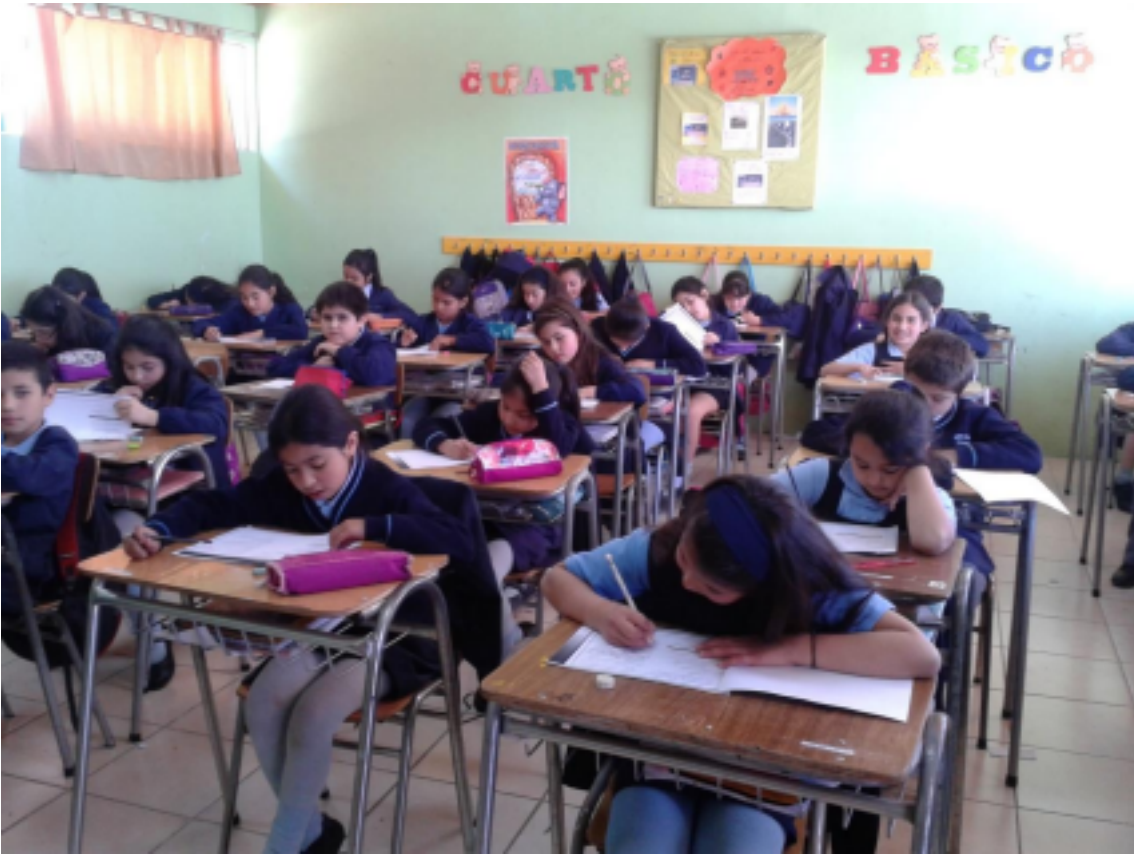
IMAGEN 8° BÁSICO