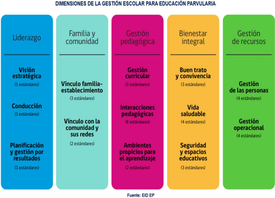
Figura 2: Dimensiones de la Gestión Escolar EID EP.

Los EID DP su organiza en 5 dimensiones de la gestión escolar, las que se dividen en dos o 3 su dimensión dimensiones con sus respectivos estándares, como se observa en la figura 2: