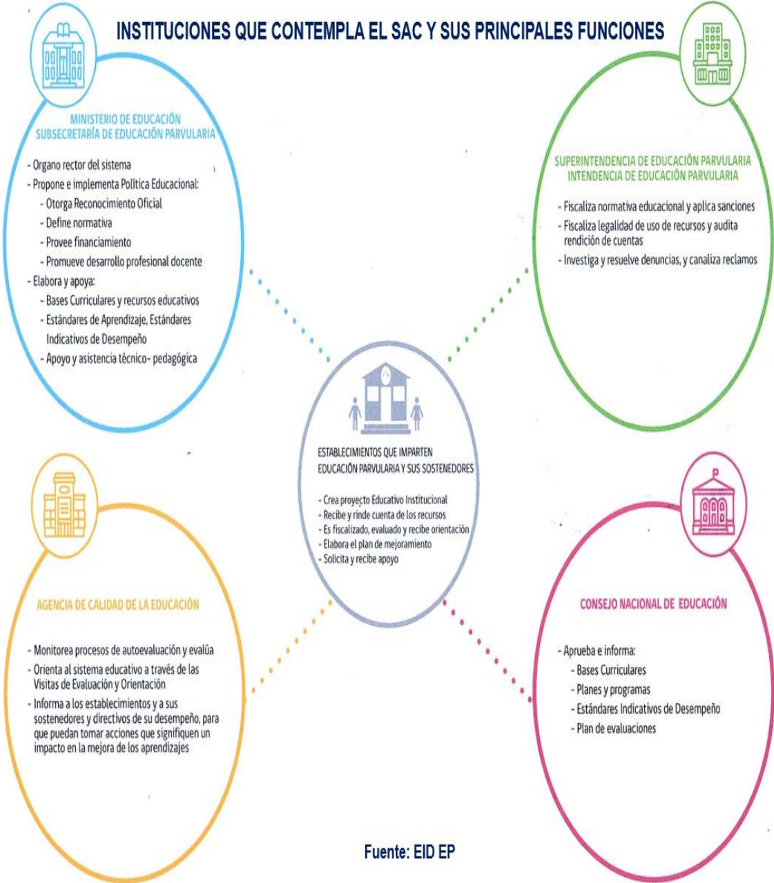
Figura 1: Instituciones que contempla el SAC EP

En la figura 1 se presentan las instituciones que componen el SAC EP, así como el rol y funciones que tiene cada una. A su vez, se aprecia una mirada global que permite vislumbrar de qué manera se articulan dichas instituciones, tanto en su conjunto, como en ellos Establecimientos de Educación Parvularia.