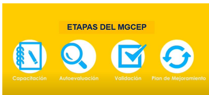
Figura 4: Etapas del Modelo de Gestión de la Calidad de la Educación Parvularia.

En la figura 4 se grafican las 4 etapas que componen el MGCEP: