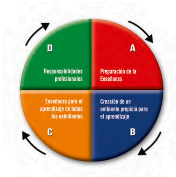
Figura 1: Marco Para la Buena Enseñanza