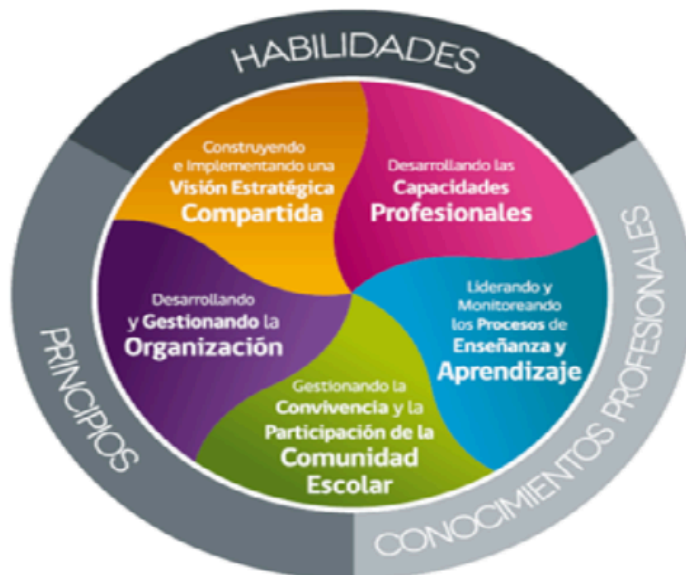
Figura 2: Marco para La Buena Dirección y El Liderazgo Escolar