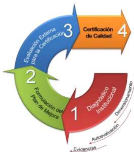
Imagen 2: Modelo de Calidad de la Gestión Escolar

En ese sentido, este proceso hacia la calidad es parte del Ciclo de Mejoramiento Continuo dicho proceso se implementa en etapas