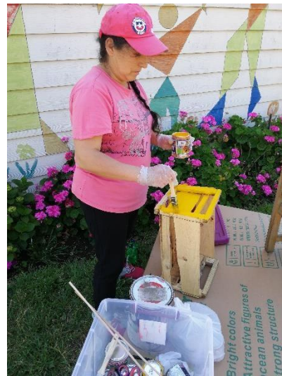
Ambientes de aprendizaje: ( rutina)