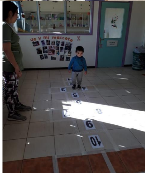
Ambientes de aprendizaje: espacio educativo