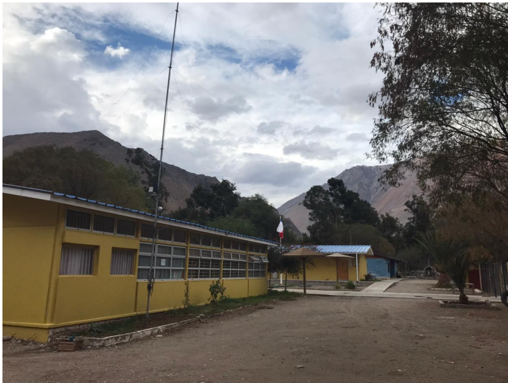
Imágenes de la Escuela "Ríos de Elqui" de Rivadavia.