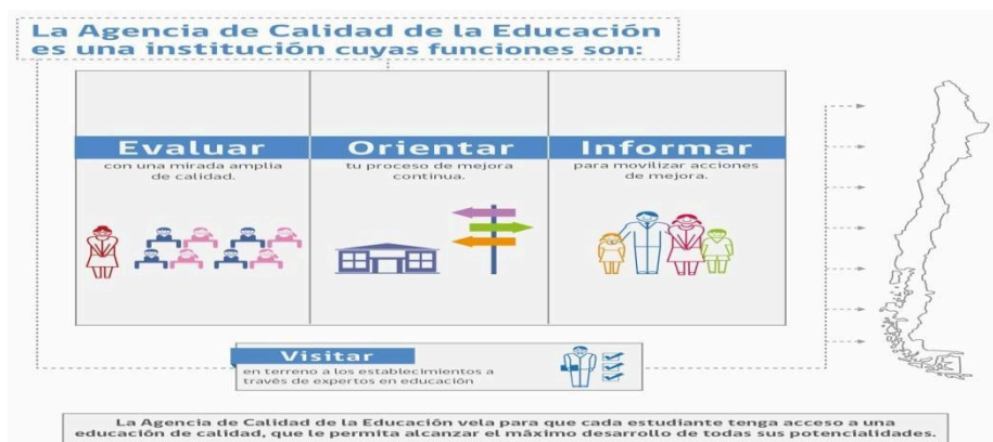
Ilustración 2