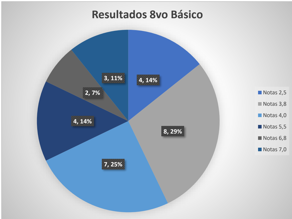
Imagen 4: Gráfico elaboración propia.

Consideramos el 57% logrado y el 43% no logrado, la escala de evaluación utilizada fue la siguiente.