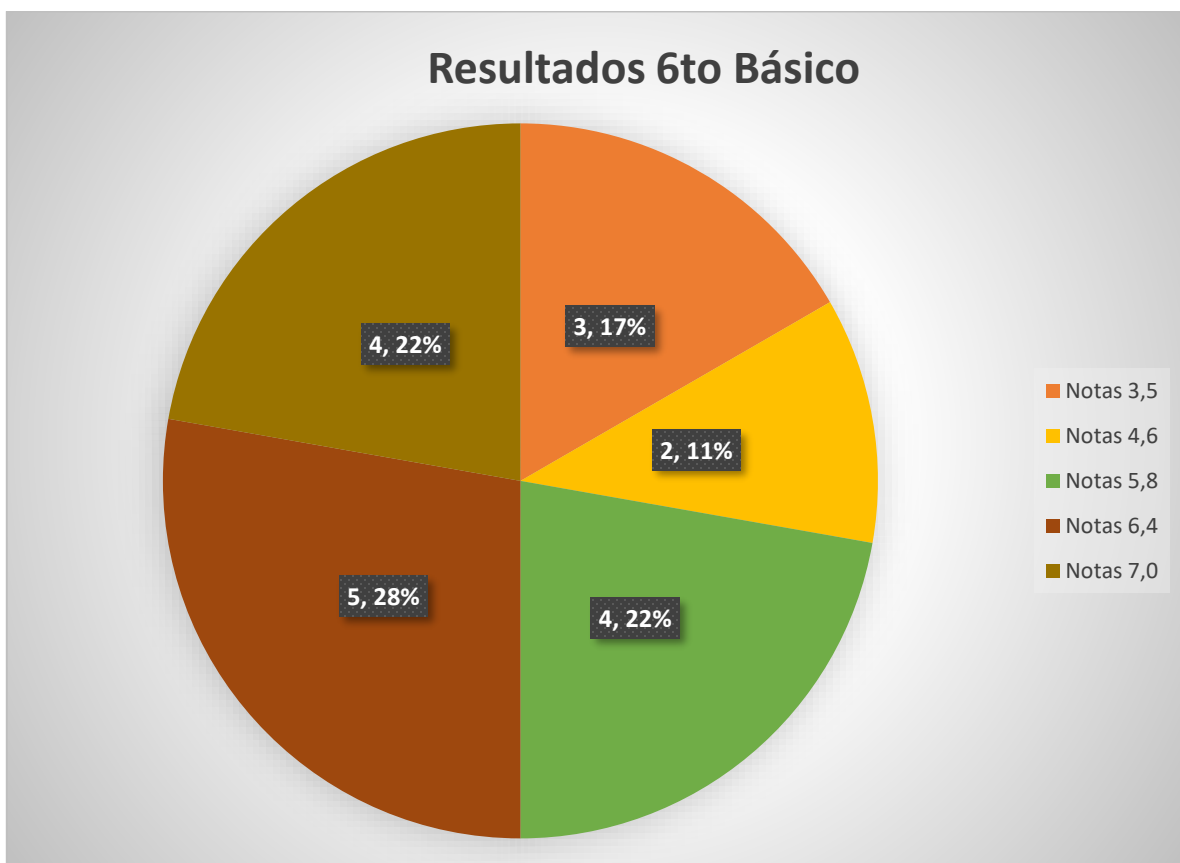
Imagen 2: Gráfico elaboración propia

De un universo de 18 estudiantes, donde 7 son varones y 11 son damas, se obtuvieron los siguientes resultados.