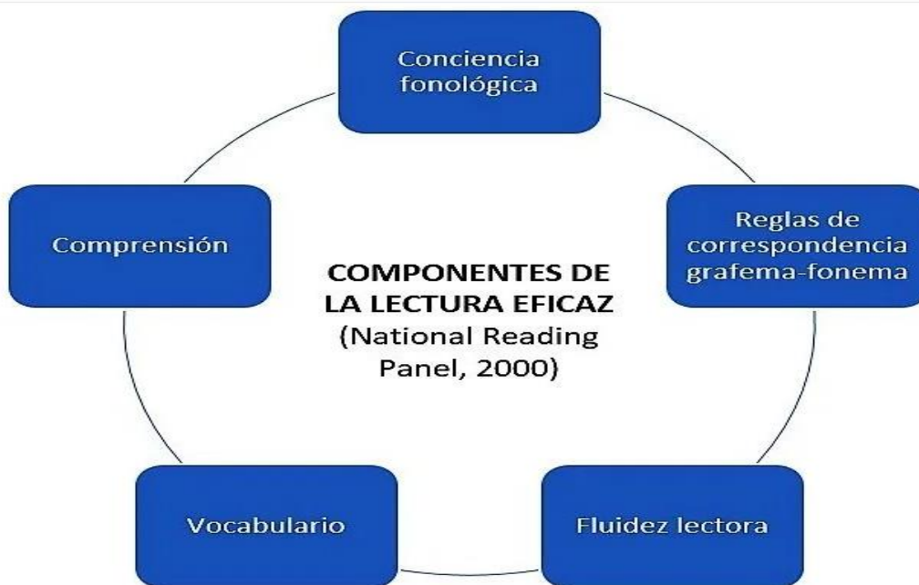
Imagen 1: (PSISE, 2020)

El proceso de la lectura automatizada, precisa y expresiva es algo que se logra con el tiempo a través de la práctica y la familiarización de las palabras.