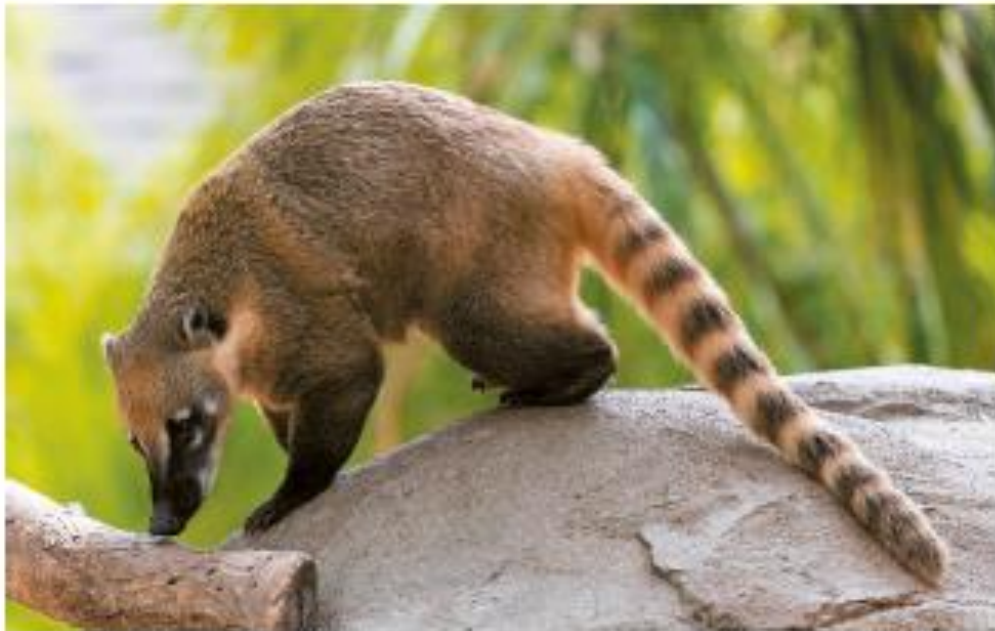
Loreto Salinas. Animales americanos . Santiago de Chile: Hueders, 2015.

Los coatís sudamericanos viven en grupos de 5 a 20 coatís, siempre juegan y se cuidan entre ellos. Ante una amenaza, un coatí alerta a sus compañeros con una especie de ladrido agudo. Asustados, todos suben rápidamente a los árboles para protegerse y mirar qué ocurre desde la altura. No son tímidos: si ven a un humano cargando bolsas se acercan a él para sacarle comida. Normalmente comen huevos e insectos, pero las frutas son su comida favorita.