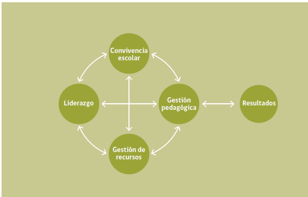
Diagrama: Áreas de Proceso y de Resultados que componen el PME

Los componentes estructurales del Modelo de Calidad de la Gestión Escolar son: Área, Dimensión y Práctica.