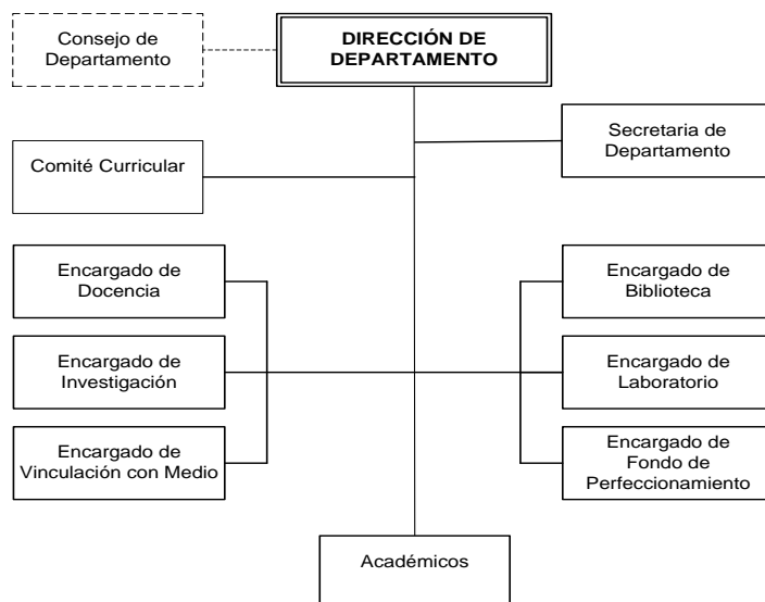
Figura N°5: Organigrama Departamento de Enfermería

En el caso de la Carrera en la Sede de Iquique, la Dirección General de Sede debe tomar conocimiento de todo acto administrativo y académico con la