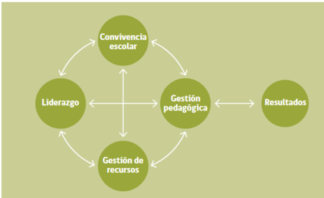
Diagrama: Áreas de Proceso y de Resultados que componen el PME

Fuente: ORIENTACIONES TÉCNICAS PARA SOSTENEDORES Y DIRECTIVOS ESCOLARES