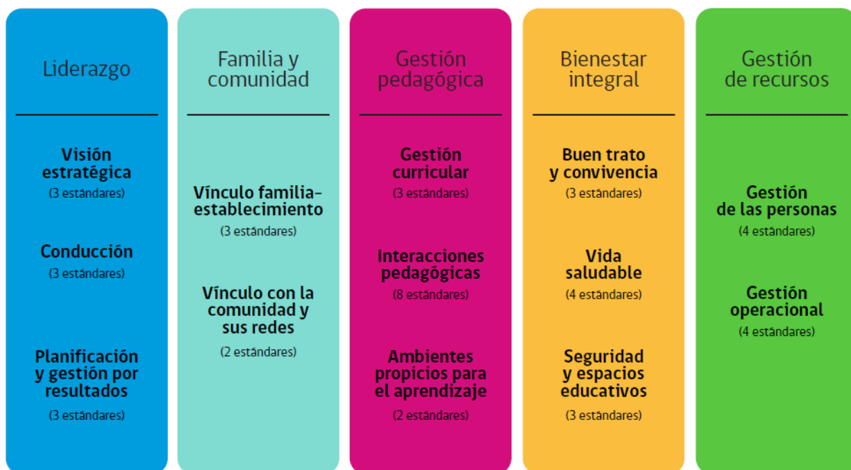
Figura N° 4 Organización de los estándares indicativos de desempeño de educación Parvularia.

Nota: Estándares Indicativos de Desempeño para los establecimientos que imparten Educación Parvularia y sus sostenedores.