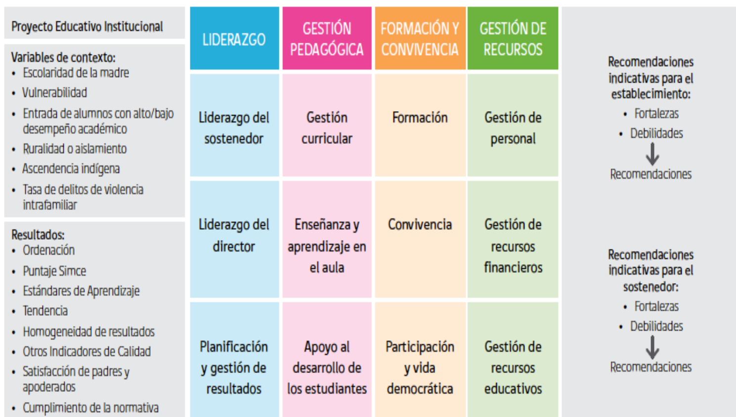
Imagen II: Elementos que considera el informe de la evaluación indicativa de desempeño

La siguiente imagen con elementos que considera el informe de la evaluación indicativa de desempeño.